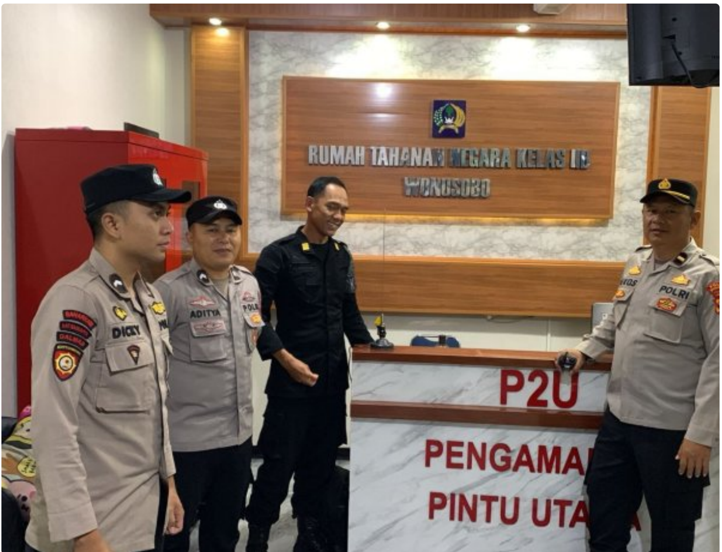
Anggota Polres Wonosobo Sambang Rutan Jelang Nataru, Situasi Aman dan Kondusif

WONOSOBO – Sebagai tindak lanjut atas koordinasi pengamanan Hari Raya Natal 2025 dan Tahun Baru 2026, sinergitas antara Rumah Tahanan Negara (Rutan) Kelas IIB Wonosobo dan Kepolisian Resor (Polres) Wonosobo semakin diperkuat. Hal ini terlihat dari intensitas Patroli Sambang yang dilakukan oleh anggota Polres Wonosobo ke Rutan Wonosobo pada Kamis malam (25/12/2025).