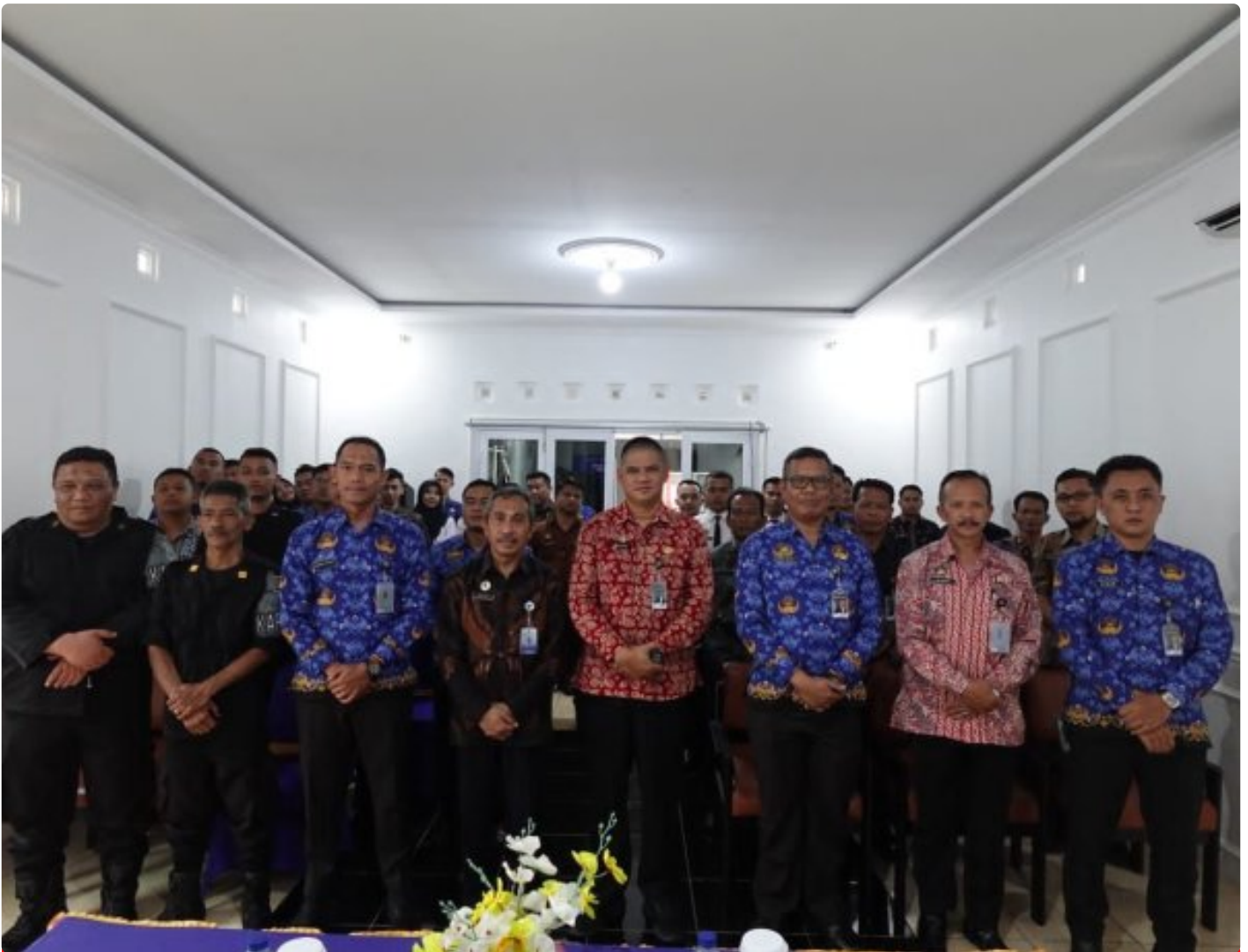
Arahan Kakanwil HAM Jateng Dorong Peningkatan Layanan Berbasis HAM di Rutan Wonosobo