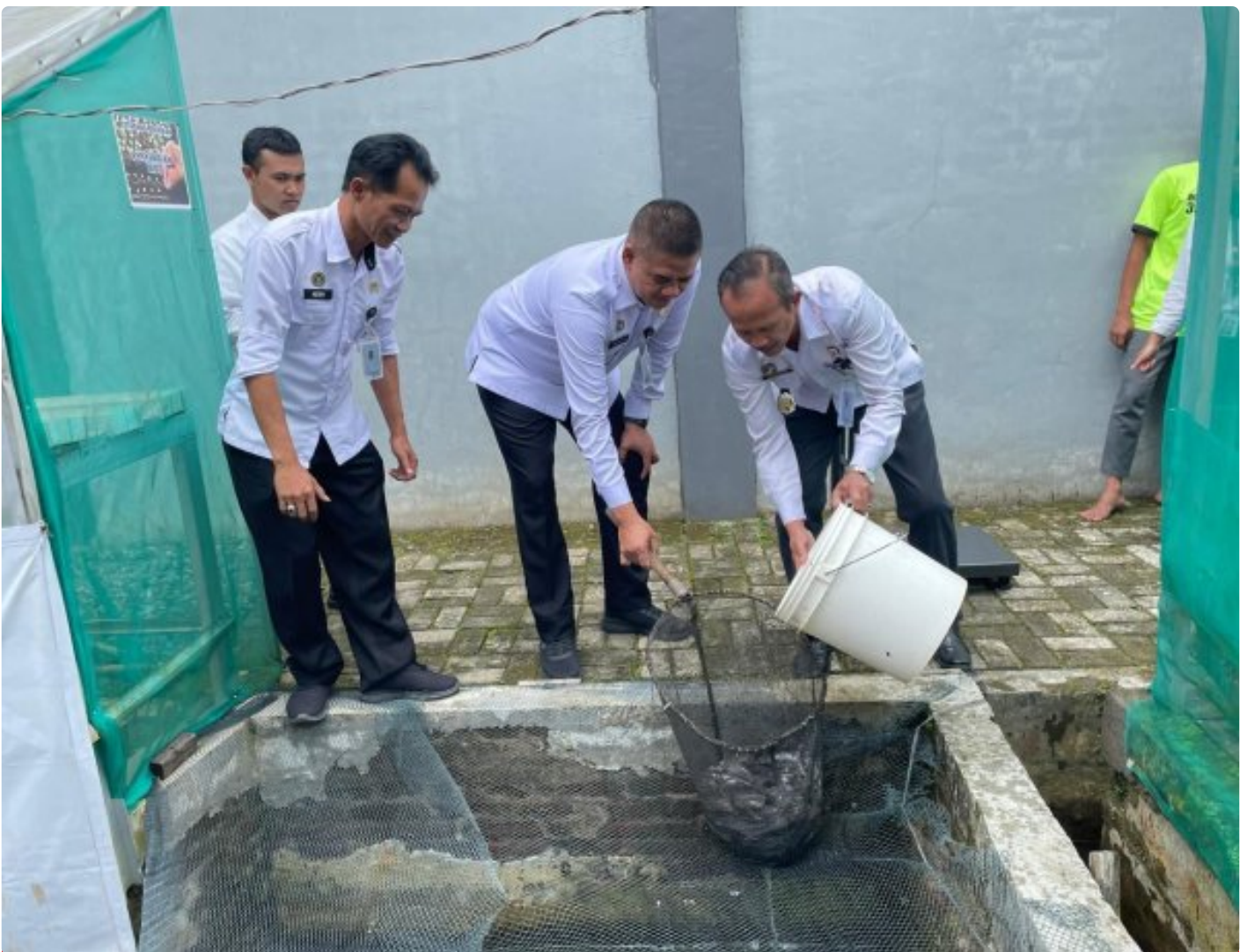
Panen Ikan Lele, Rutan Wonosobo Perkuat Ketahanan Pangan Melalui Pembinaan Kemandirian Bidang Perikanan

Wonosobo – Rumah Tahanan Negara (Rutan) Kelas IIB Wonosobo terus menunjukkan komitmennya dalam mendukung program ketahanan pangan nasional melalui pembinaan kemandirian bagi warga binaan. Pada Rabu, 31 Desember 2025, Rutan Wonosobo melaksanakan kegiatan panen ikan lele