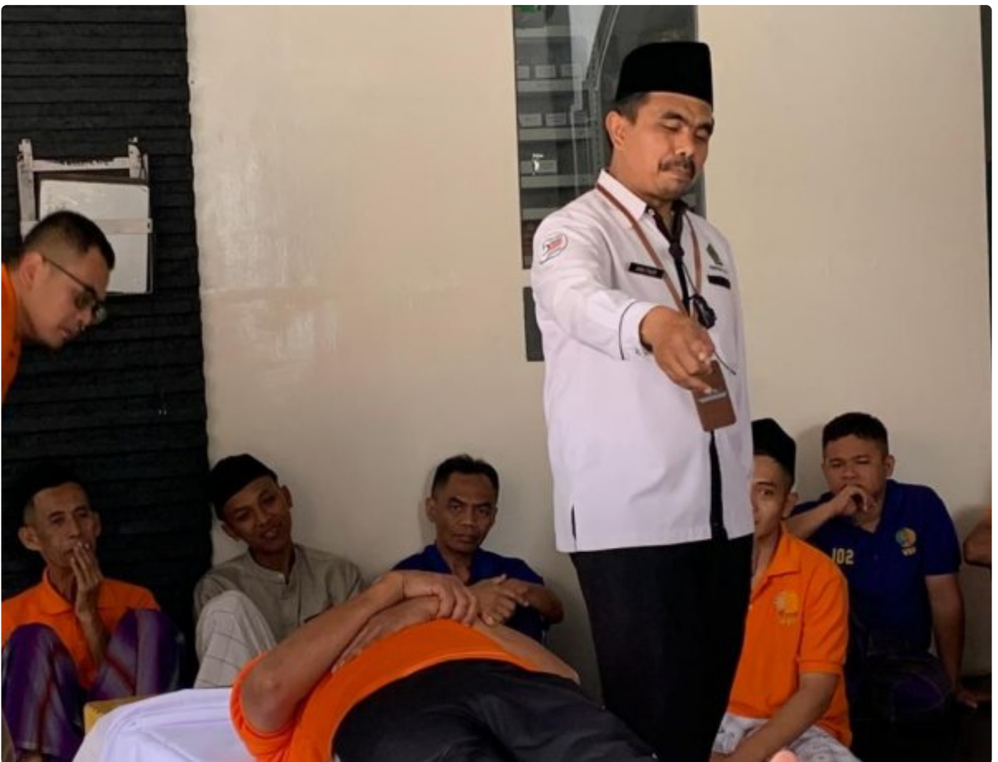
Pembinaan Bermakna di Akhir Tahun, Warga Binaan Rutan Wonosobo Ikuti Pelatihan Pemulasaran Jenazah

Wonosobo – Dalam upaya meningkatkan pembinaan keagamaan dan keterampilan spiritual warga binaan, Rumah Tahanan Negara (Rutan) Kelas IIB Wonosobo bekerja sama dengan Kementerian Agama (Kemenag) Kabupaten Wonosobo menyelenggarakan kegiatan pelatihan pemulasaran jenazah pada