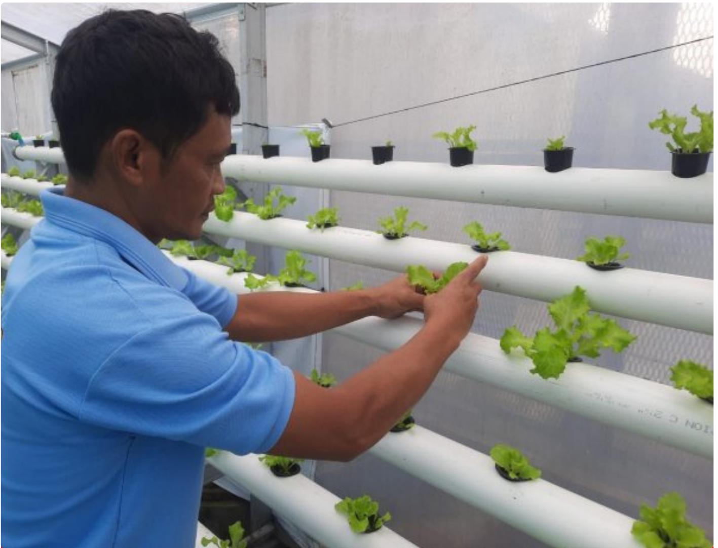
Program Hidroponik Rutan Wonosobo, Solusi Cerdas Atasi Minimnya Lahan

Wonosobo - Rutan Kelas IIB Wonosobo terus mengembangkan program ketahanan pangan melalui budidaya selada dengan metode hidroponik.