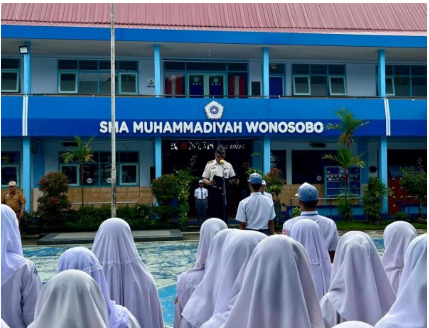
Rutan Wonosobo Ambil Peran Aktif Sosialisasikan Sekolah Ramah Anak di SMA Muhammadiyah Wonosobo

Wonosobo – Rumah Tahanan Negara (Rutan) Kelas IIB Wonosobo turut berpartisipasi dalam kegiatan sosialisasi Sekolah Ramah Anak yang dilaksanakan di SMA Muhammadiyah Wonosobo pada Senin, (12/01/2026).