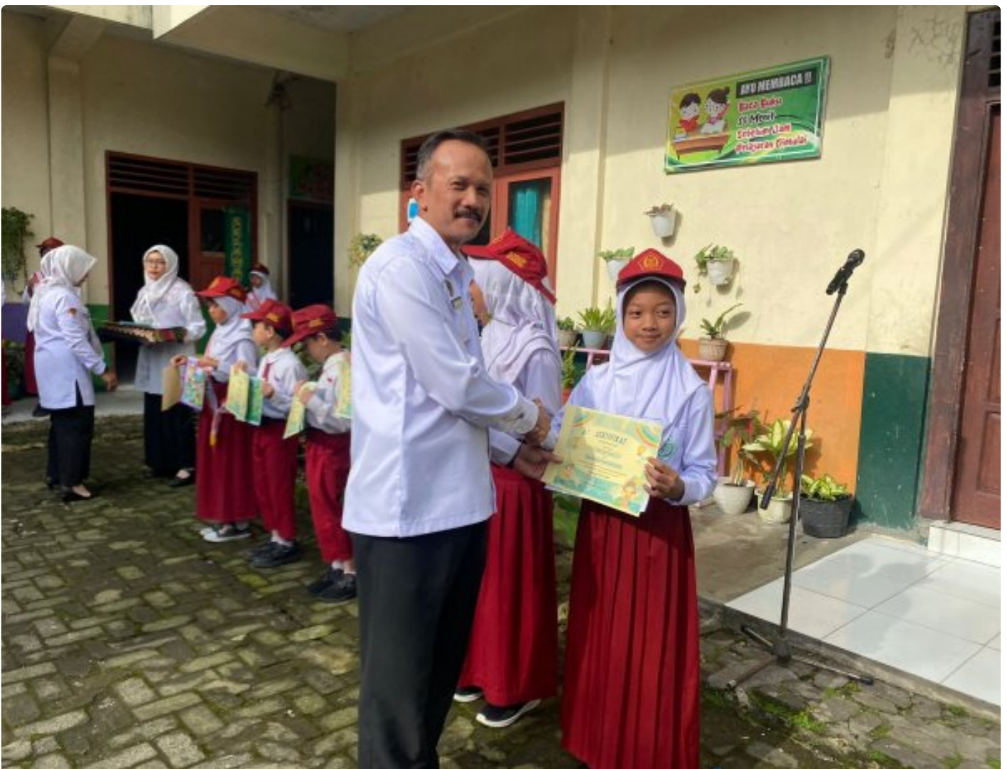
Safari Ramah Anak, Rutan Kelas IIB Wonosobo Tanamkan Inspirasi Positif di MI Ma'arif Kalianget